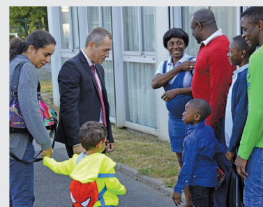
Le 1 er septembre au groupe scolaire Joliot-Curie.