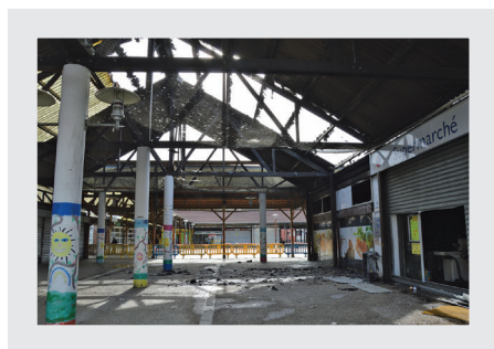
Place du 8-Mai-1945, suite à l'incendie d'un des commerces, en avril 2016.