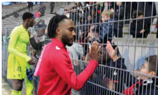
Les joueurs floriacumois, toujours plus proches de leurs fidèles supporters.

velle Ligue 3, 100 % professionnelle, qu'il faudra compter sur nos «Lions» de Fleury-Mérogis. Dès le 8 août prochain, avec un statut cette fois-ci de favoris à la montée, ils connaîtront sans doute «une saison encore plus difficile que celle-ci» (D. Vignes). Fred reste admiratif: «Félicitations pour cette super saison. Pour une première en National, finir au pied du podium est déjà magnifique et encourageant!» «Avec quelques recrues bien ciblées, on peut s'attendre à une équipe encore plus forte la saison prochaine!», prédit Ced. Messieurs, en un mot: bravo! ■