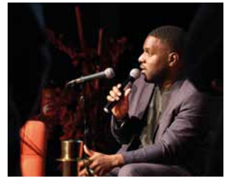
M. le Maire répond aux Floriacumois.