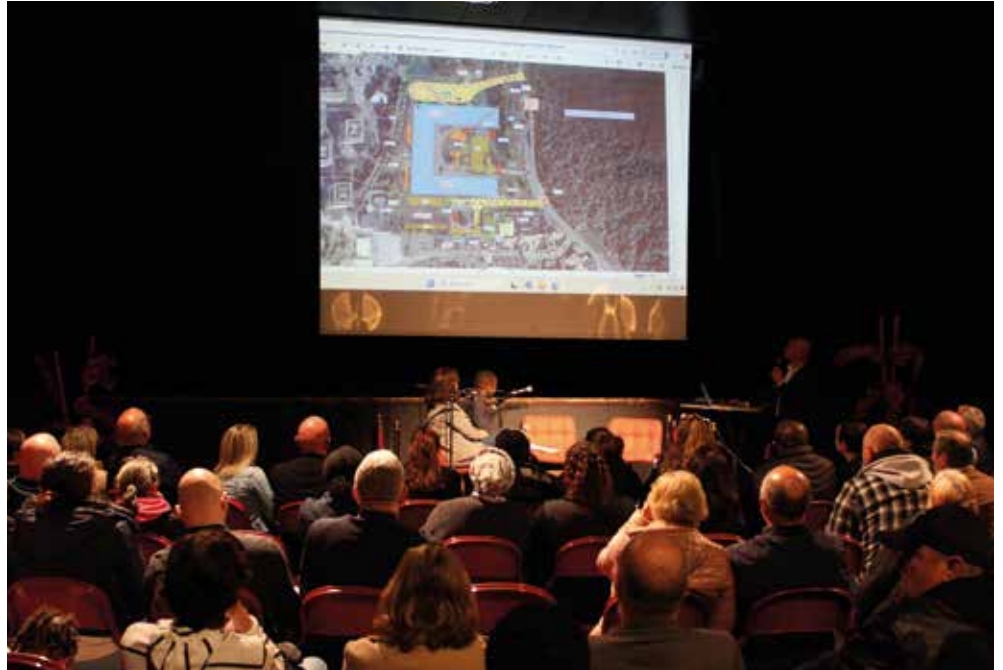
De nombreux habitants, salle Malraux, pour vivre ensemble les deux projets.