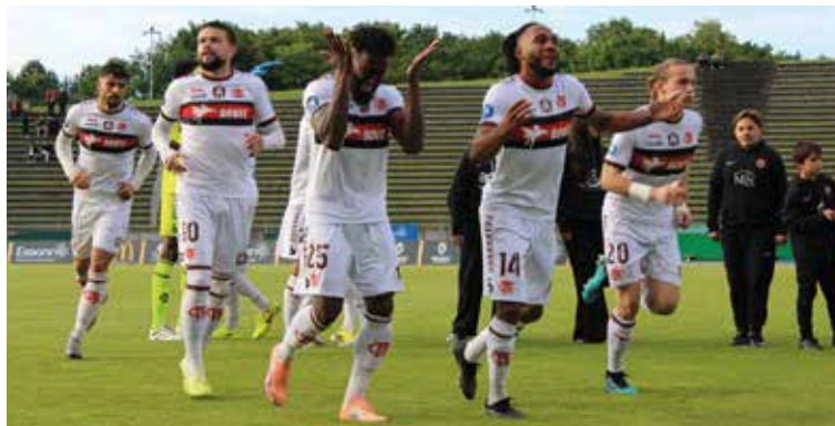
Des Lions qui auront toujours faim de victoires !