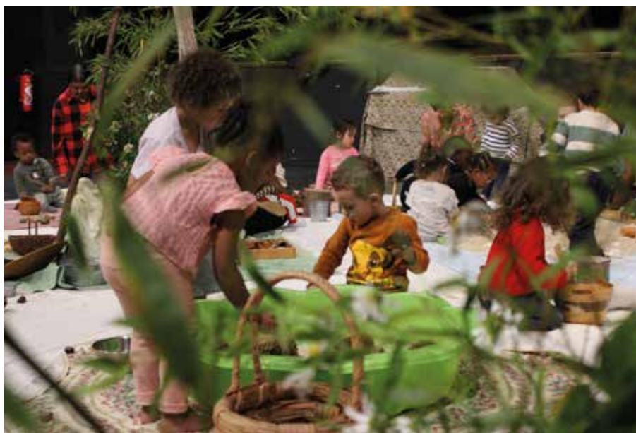
↑ Le plein d'animations dans les centres et les crèches (ici, le jardin sensoriel et créatif) pour la Fête de la Nature.