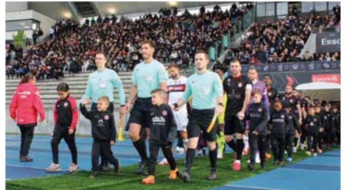
L'entrée des joueurs à l'Essonne Stadium !