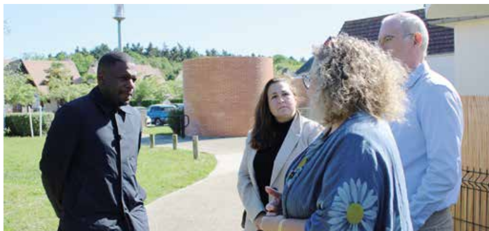
Rencontre entre les élus, les agent(e)s et les tout-petits.

Ce moment d'échange a permis de dialoguer avec les agent(e)s qui, au quotidien, accompagnent avec attention les tout-petits floriacumois et soutiennent les parents dans cette étape importante de leur vie. Un temps de partage précieux aussi pour parler des besoins du terrain. ■