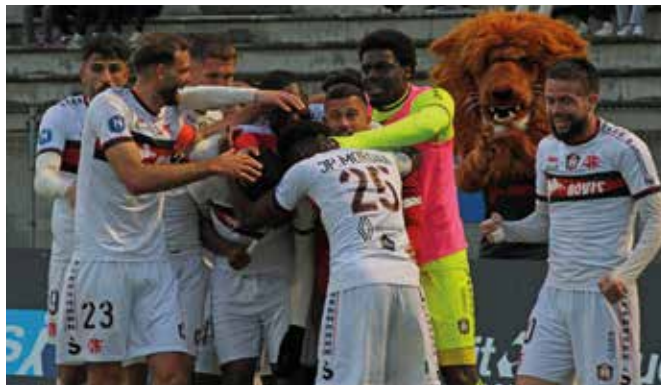
La joie des Floriacumois lors de l'ouverture du score (61 e ).