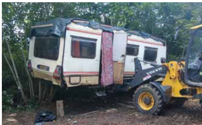
Une réactivité collective, une intrusion maîtrisée.

procédure d'évacuation, le site a rapidement été sécurisé afin d'éviter toute nouvelle intrusion. La Ville remercie l'ensemble des agents mobilisés, les ASVP, la gendarmerie et autres partenaires pour leur réactivité. ■