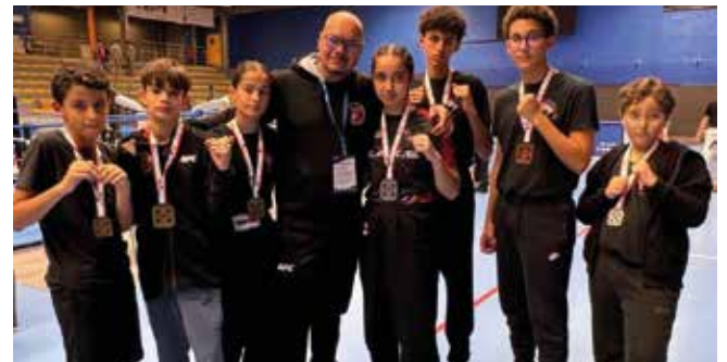
La Team EAKS (MMA).