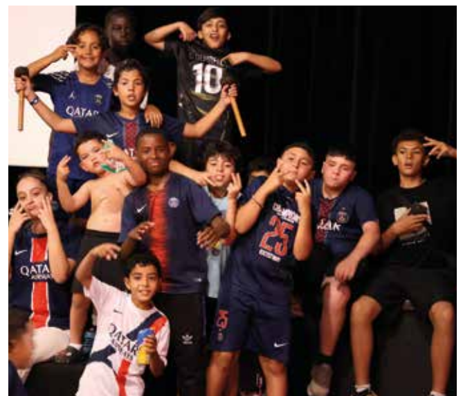
Ambiance de stade à la salle Malraux.

était «LE» rendez-vous à ne pas rater en cette fin du mois de mai. Au bout du suspense, la victoire historique du PSG restera à jamais gravée dans les mémoires de tous ces jeunes et moins jeunes venus vivre le sacre des Parisiens face à Arsenal. Un bel événement qui en appelle plein d'autres à Fleury-Mérogis tant les habitants sont fans de ces beaux moments de partage. ■