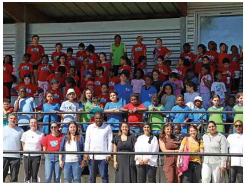
Une belle action qui a rassemblé tous les enfants de l'école.