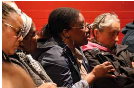
Les questions étaient nombreuses.