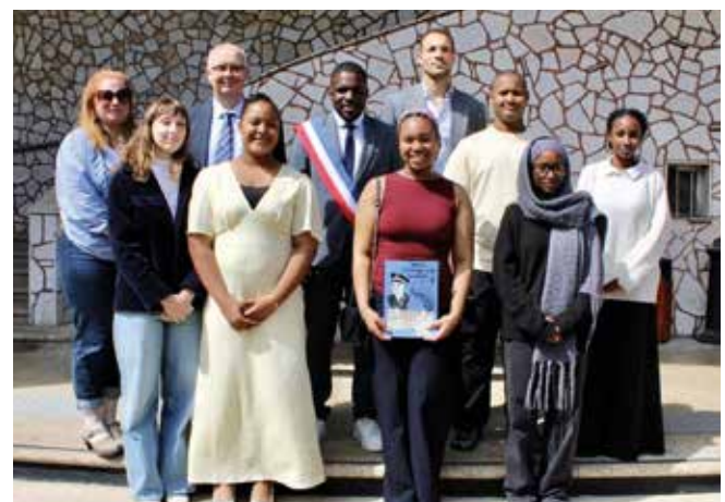
Les élèves de 3 e du collège Paul-Éluard participent au CNRD.

Soukouna, Maire). Un engagement de tous les instants, à tout âge. Lors de cette cérémonie départementale, des élèves de 3 e du collège Paul-Éluard ont lu des poèmes et, aussi, présenté leur travail autour de Pierre-Henri Manhès présenté au concours national de la Résistance et de la Déportation (CRND). ■