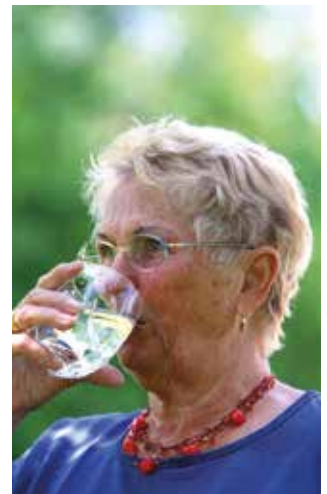
Buvez de l'eau!

Jeunes ou moins jeunes, adoptez les bons réflexes dès à présent et durant tout l'été. Pensez à fermer volets et fenêtres en journée, limitez les déplacements, buvez au minimum 1,5 litre d'eau par jour, munissez-vous d'un brumisateur, préparez-vous des repas légers et frais. Ensemble, restons vigilants! ■