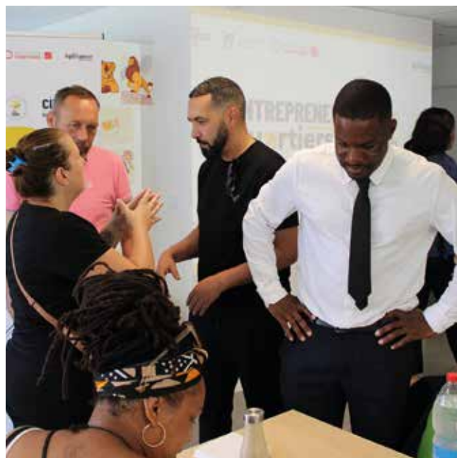
Une rencontre riche en échanges, porteuse d'opportunités.

«Votre quartier n'est pas une limite, c'est un point de départ.» ■