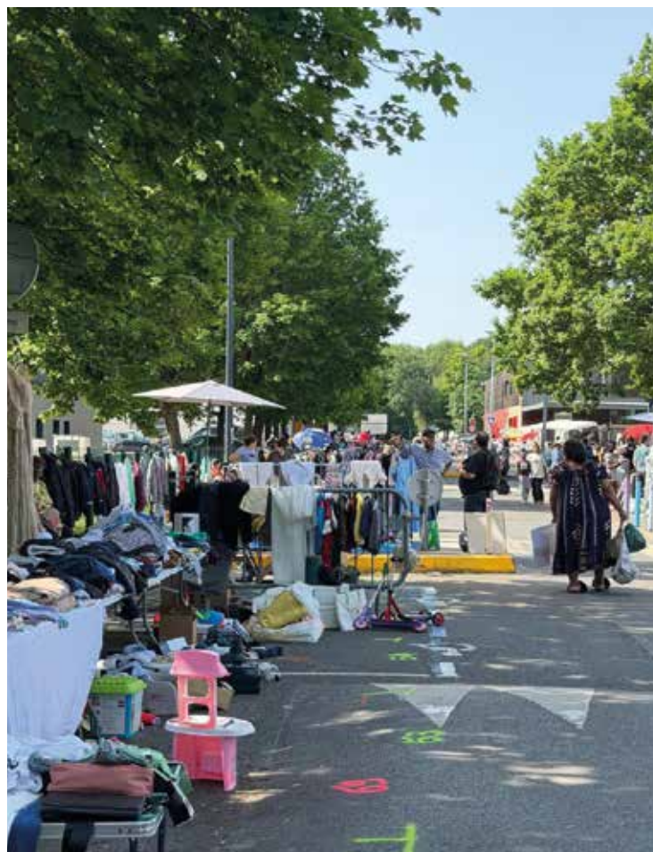
Une belle brocante aux Aunettes le 24 mai, organisée par les associations Famil Ystret et Asso Saison II. →