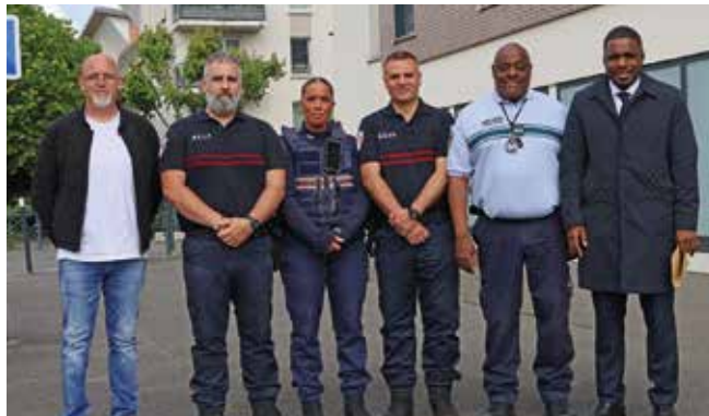
Les agents du service ASVP aux côtés des élus.