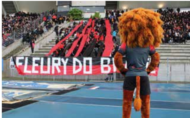
La mascotte admirative devant la ferveur du public.