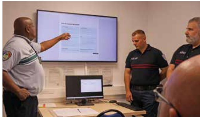
Objectif : assurer une ville plus sereine et agréable à vivre.

Le 7 mai, les élus sont allés à la rencontre de la Police rurale de Fleury-Mérogis. L'occasion de rencontrer l'équipe du service ASVP.