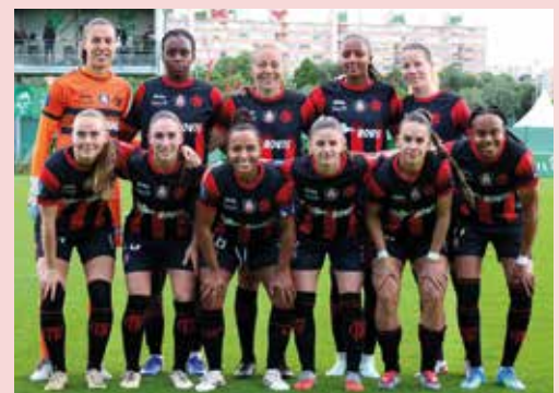
Rendez-vous en août pour une 10 e saison en élite.

« La saison prochaine, il faudra plus de guerrières sur le terrain ! » « Une saison honorable pour les filles, vivement la prochaine avec, on l'espère, une place en Ligue des champions féminine. » Allez Fleury !