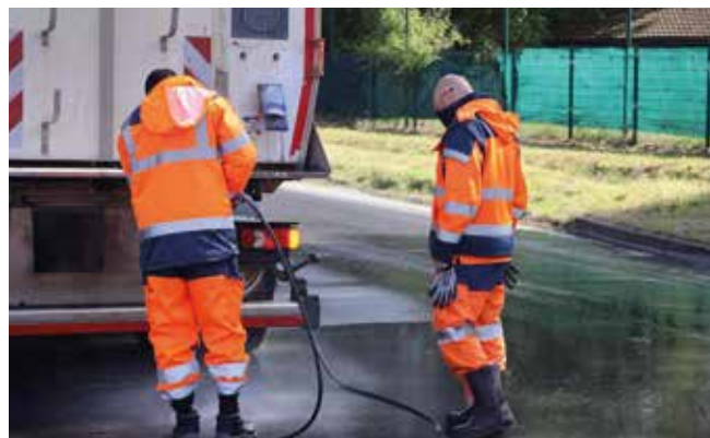
Le travail des ASVP a porté ses fruits.

convocation par la Police rurale de Fleury-Mérogis. Encore une fois, le professionnalisme du service ASVP a permis un traitement rapide de l'incident, la société concernée ayant procédé à la remise en état de la voirie. ■