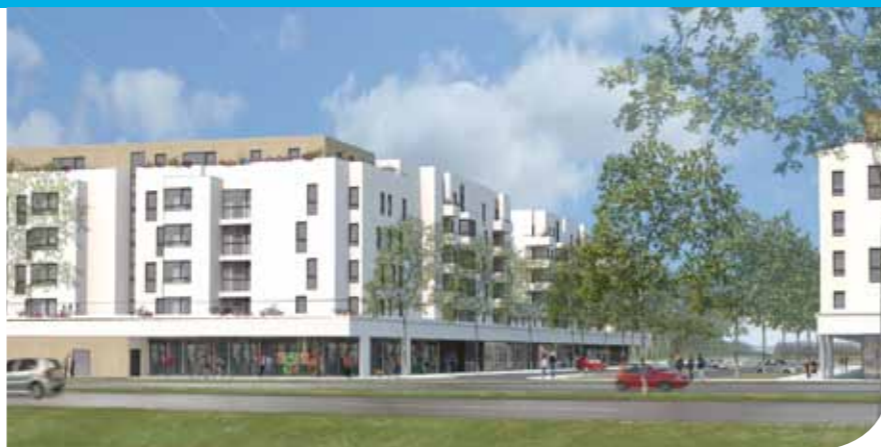
esquisse non contractuelle

Une nouvelle étape importante vient d'être franchie dans le projet des Joncs-Marins, dont les permis de construire étaient jusqu'à aujourd'hui bloqués suite à un avis défavorable de l'État.