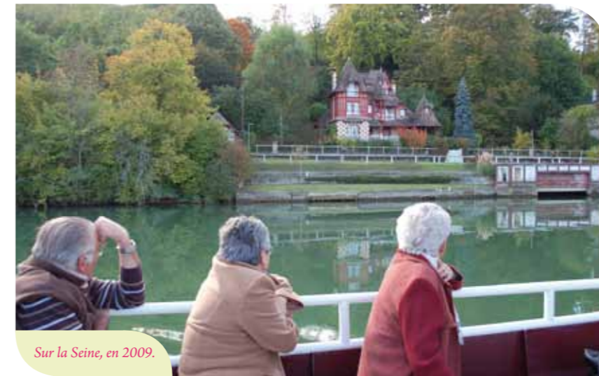
Sur la Seine, en 2009.

Chaque année, la Semaine bleue rencontre un vrai succès auprès de nos aînés.