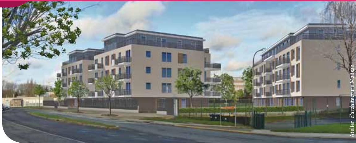
Atelier d'architecture Malisan