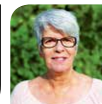
Aline Cabeza , maire-adjointe chargée de l'Action sociale, du Logement et de la Lutte contre les discriminations