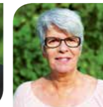
Aline Cabeza, maire-adjointe chargée de la Culture, du Logement et de la Lutte contre les discriminations