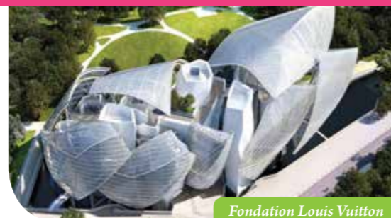
Fondation Louis Vuitton

Chaque mois, un programme de sorties, activités et services est proposé aux retraités de la ville.